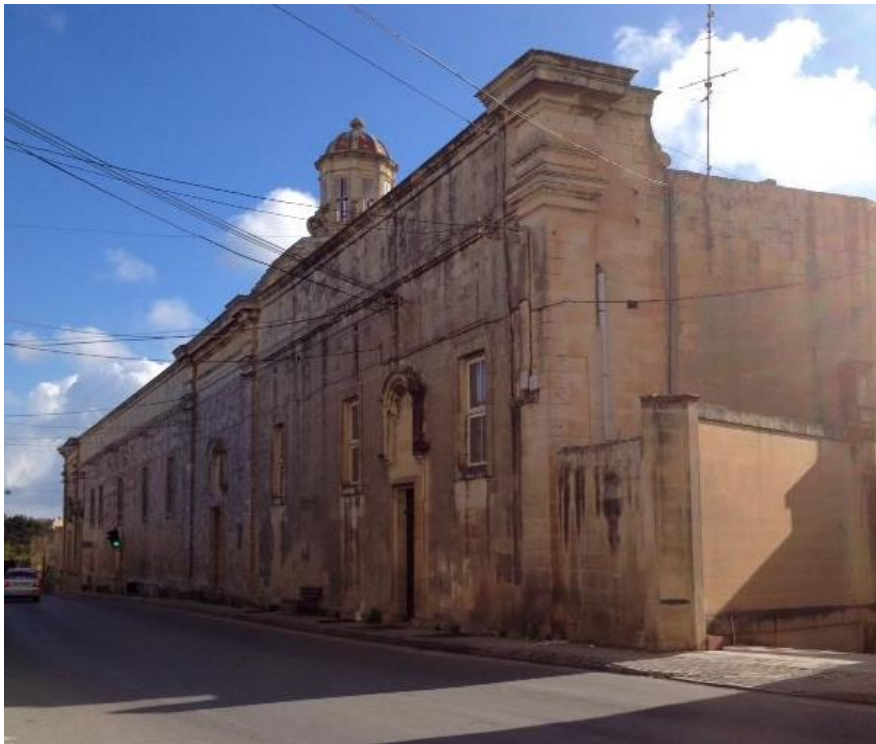
Dar Saura - Rabat