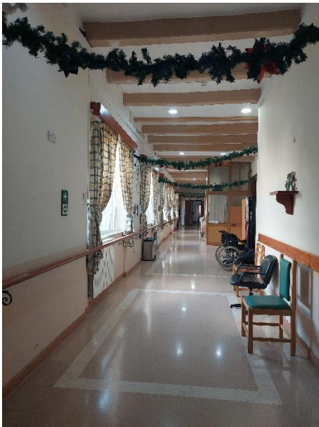
Az otthon egyik folyosója