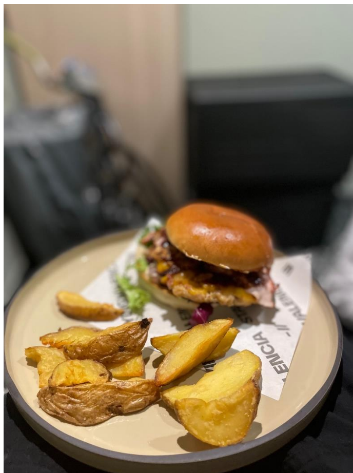
A képen látható egy Chicken Burger, sült burgonyával